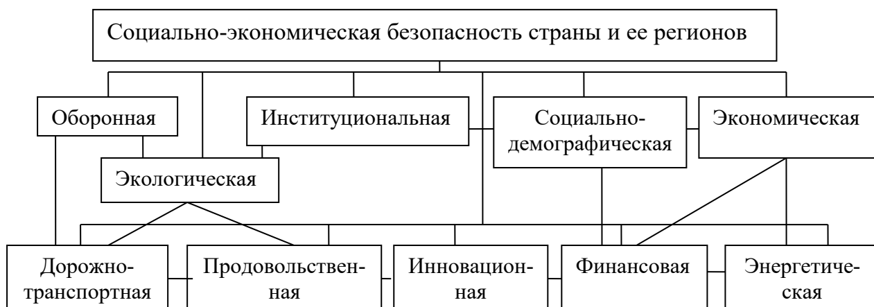
Рис. 3.1. Социально-экономическая безопасность и ее слагаемые

Социально-экономическая безопасность страны и ее регионов характеризуется демографической стабильностью, удовлетворенностью большинства населения, представляющего различные социальные, этнические и демографические группы, своим материальным благосостоянием и социальным статусом, что определяет понимание базовых интересов общества, законопослушность, доверие власти, активное участие в обсуждении и принятии управленческих решений.