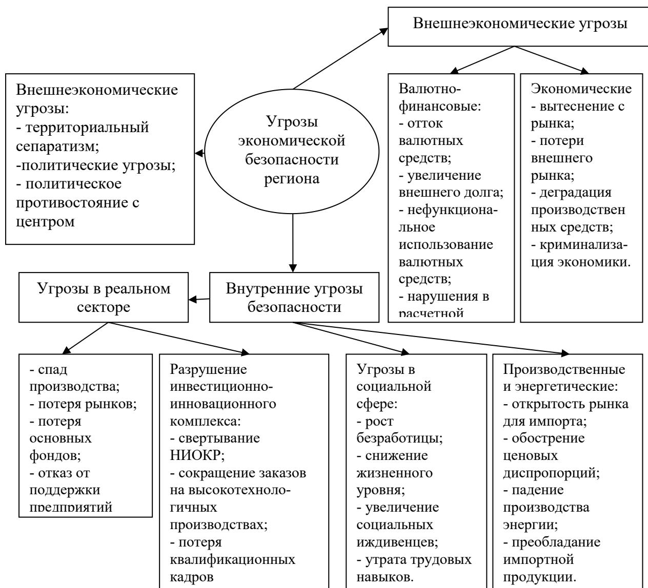
Рис. 1.1. Угрозы экономической безопасности региона

Основные угрозы экономической безопасности региона условно можно разделить на две группы: внутренние и внешнеэкономические (см. рис. 1.1.).