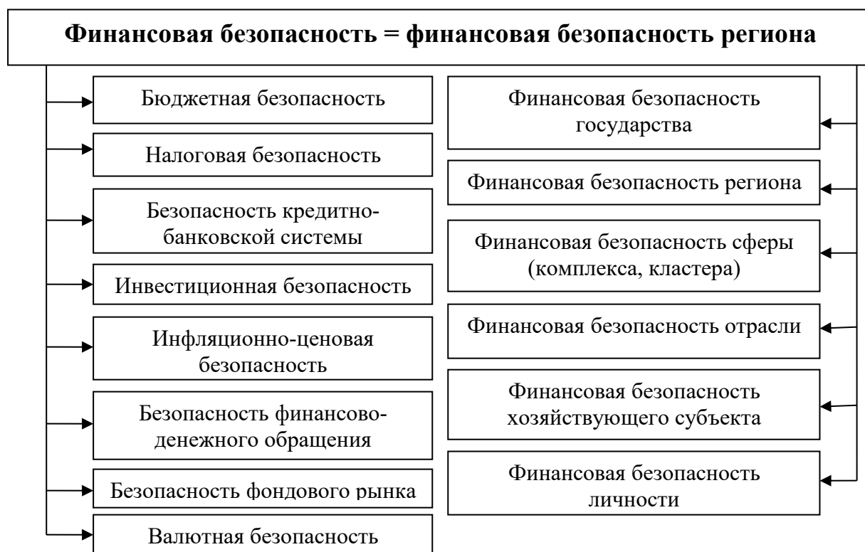
Рис. 4.1. Типы финансовой безопасности

Финансовая безопасность обладает собственным содержанием и позволяет выделить ее типологические особенности (см. рис. 4.1.), скорректированные на проблематику направлений деятельности финансовой системы. Все элементы (типы) финансовой безопасности проецируемы на регион, взаимосвязаны между собой и взаимообусловлены друг другом, и ориентированы на обеспечение финансовой устойчивости.